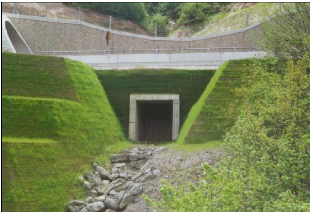
Album fotografico terre rinforzate Rev1.doc