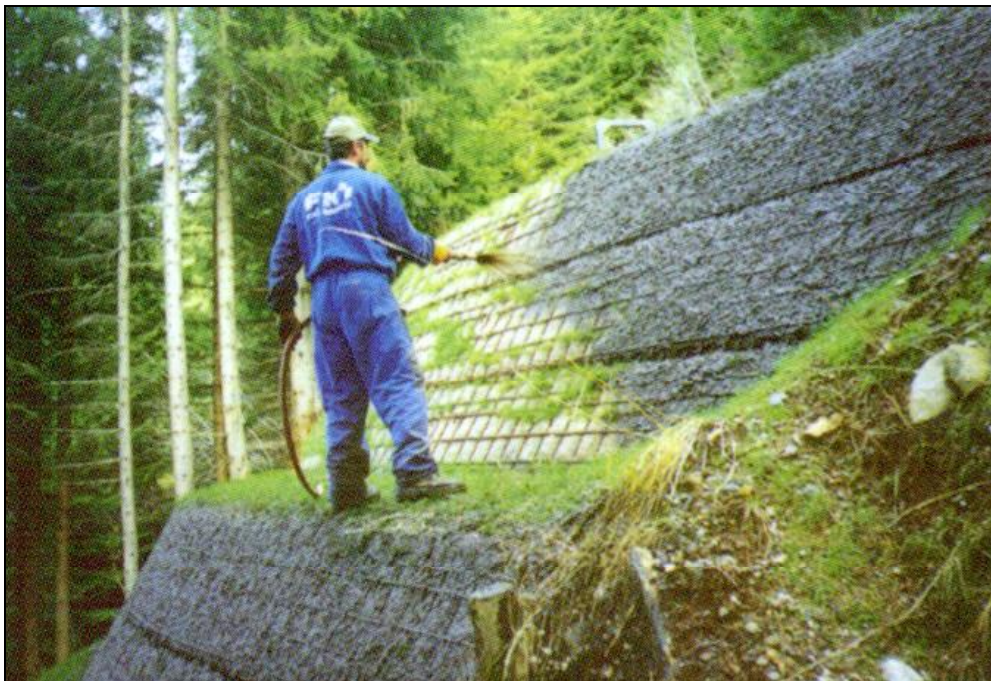
Album fotografico terre rinforzate Rev1.doc