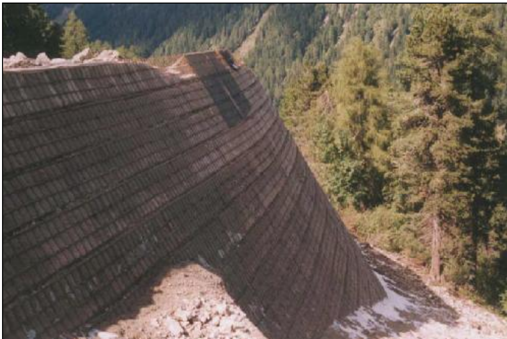
Album fotografico terre rinforzate Rev1.doc